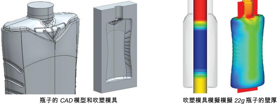
瓶子的 CAD 模型和吹塑模具